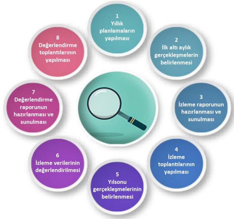
Şekil-4 İzleme ve Değerlendirme Süreci

İzleme ve değerlendirme sürecinin işleyişi ana hatları ile yukarıdaki şekilde özetlenmiştir. Okulumuz Stratejik Planı izleme ve değerlendirme çalışmalarında 5 yıllık Stratejik Planın izlenmesi ve 1 yıllık gelişim planının izlenmesi olarak ikili bir ayrıma gidilecektir.